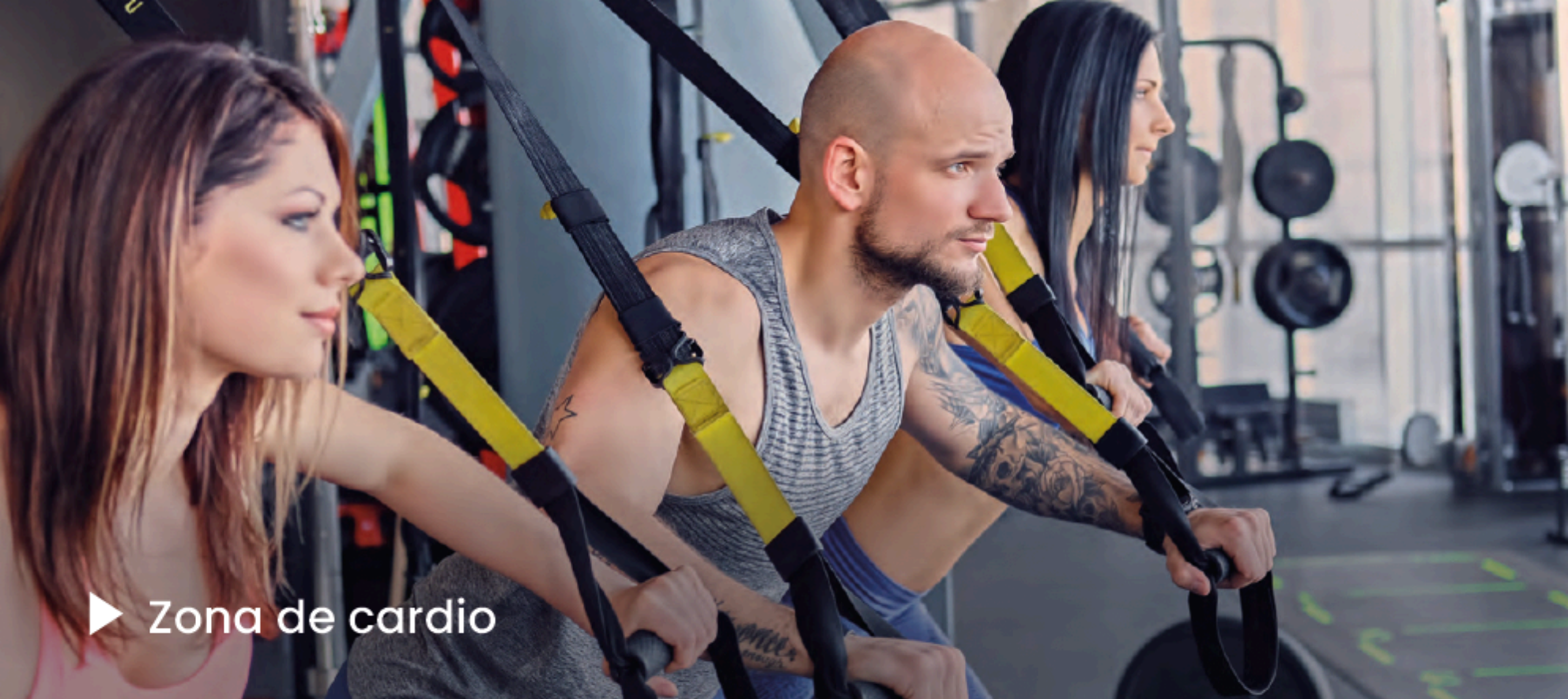
▶ Zona de cardio