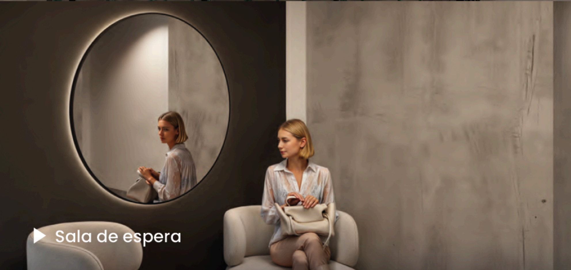
▶ Sala de espera