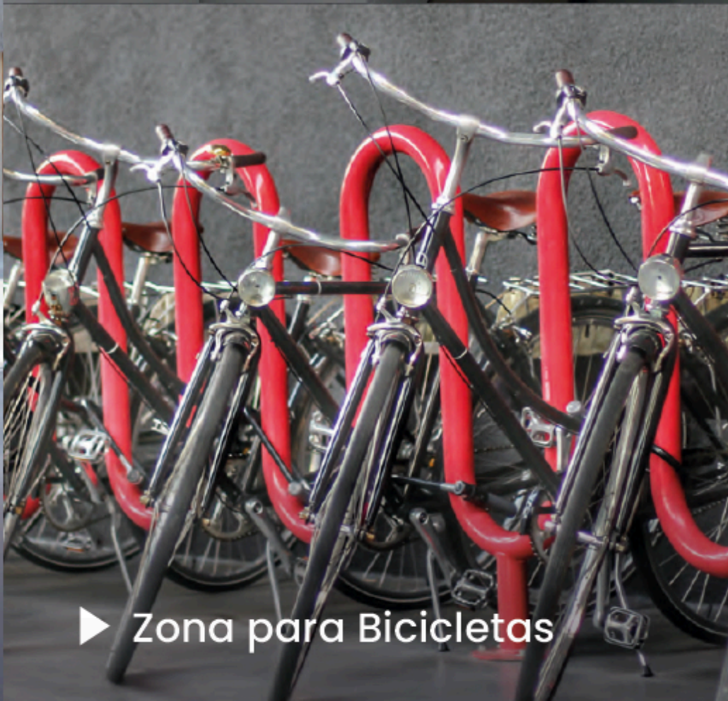
▶ Zona para Bicicletas