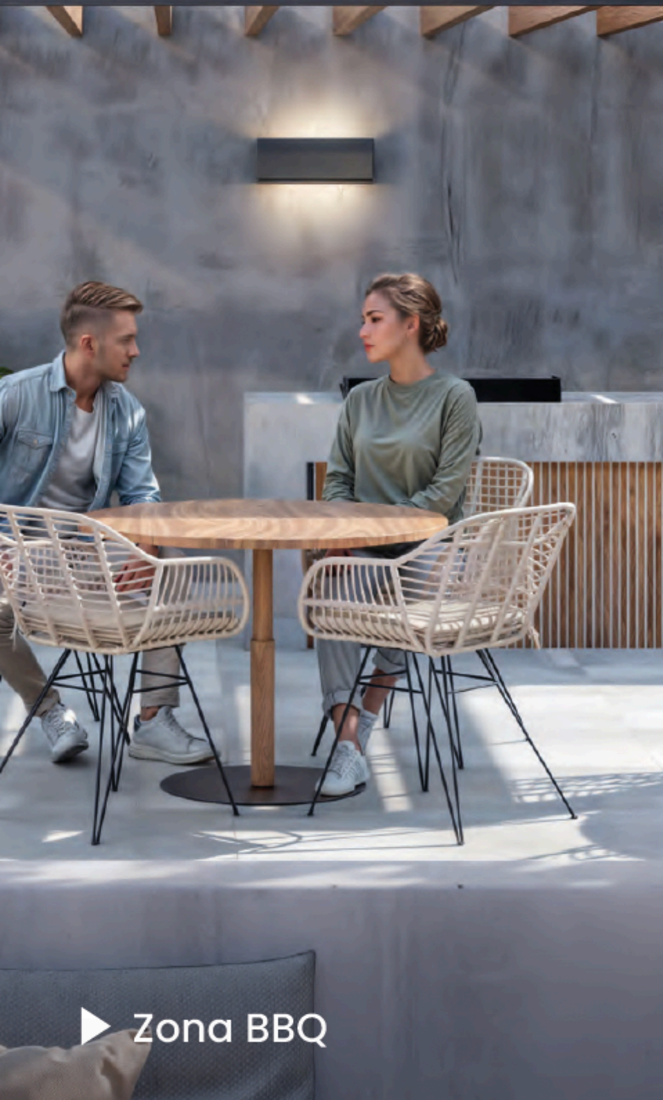
▶ Zona BBQ